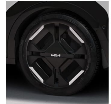
Jantes en Alliage 19" avec pneus 215/50 R19 (De série sur GT Line) 19" lichtmetalen velgen met 215/50 R19 banden (Standaard op GT Line)