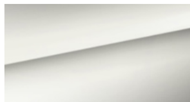
Ivory Silver Mat (ISM)*** (Disponibile unicamente en Business Plus et GT Line) (Enkel beschikbaar op Business Plus en GT Line)