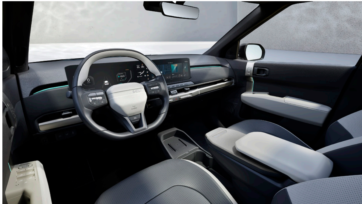
Cuir vegan - Gris Foncé/Gris Clair & Ciel de Toit - Noir (de série sur GT Line) Cuir vegan - Gris Foncé/Gris Clair & Ciel de Toit - Gris (de série sur Business Plus) Vegan leder - Donkergrijs/Lichtgrijs & Dakhemel - Zwart (standaard op GT Line) Vegan leder - Donkergrijs/Lichtgrijs & Dakhemel - Grijs (standaard op Business Plus)