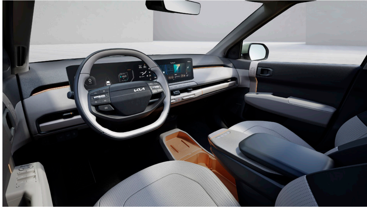
Tissu - Gris/Gris Foncé & Ciel de Toit - Gris (de série sur Business et Earth) (Espace de rangement en couleur orange pas disponible en Belgique) Stof - Grijs/Donkergrijs & Dakhemel - Grijs (standaard op Business en Earth) (Orange opslagruimte niet beschikbaar in België)