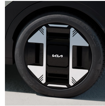
Jantes en Alliage 19" avec pneus 215/50 R19* (Option sur Business Plus) 19" lichtmetalen velgen met 215/50 R19 banden* (Optie op Business Plus)