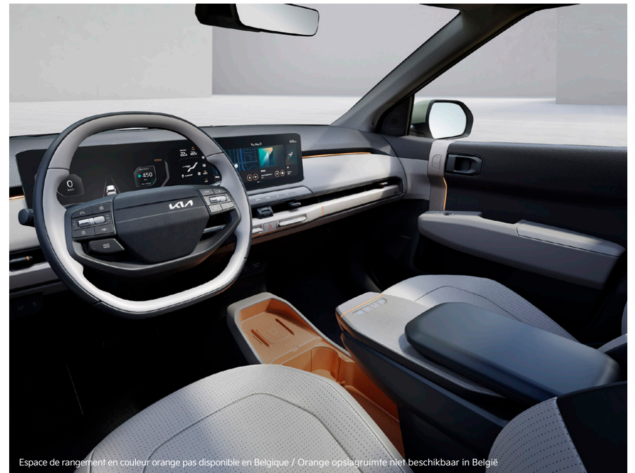
Espace de rangement en couleur orange pas disponible en Belgique / Orange opslagruimte niet beschikbaar in België